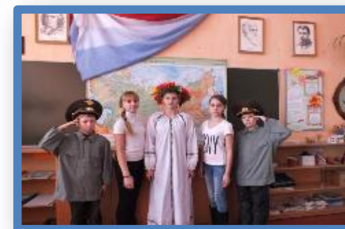
Проект ОНЛАЙН-ФОТОКРОСС «Территория закона»