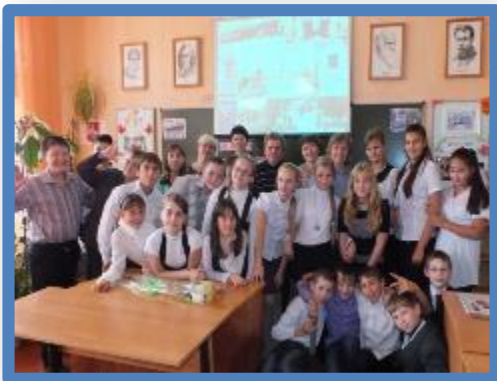
Литературная мастерская «День памяти тем»