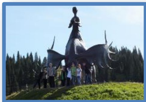
Проект «Застывшая память» фотопутешествие по памятникам г.Таштагола