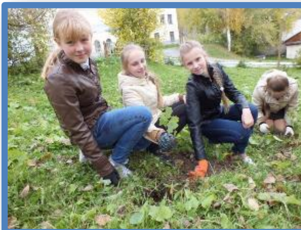
Акция «Подарок городу» дубовая роща своими руками