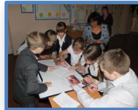
Интерактивная игра «Срочно в номер»